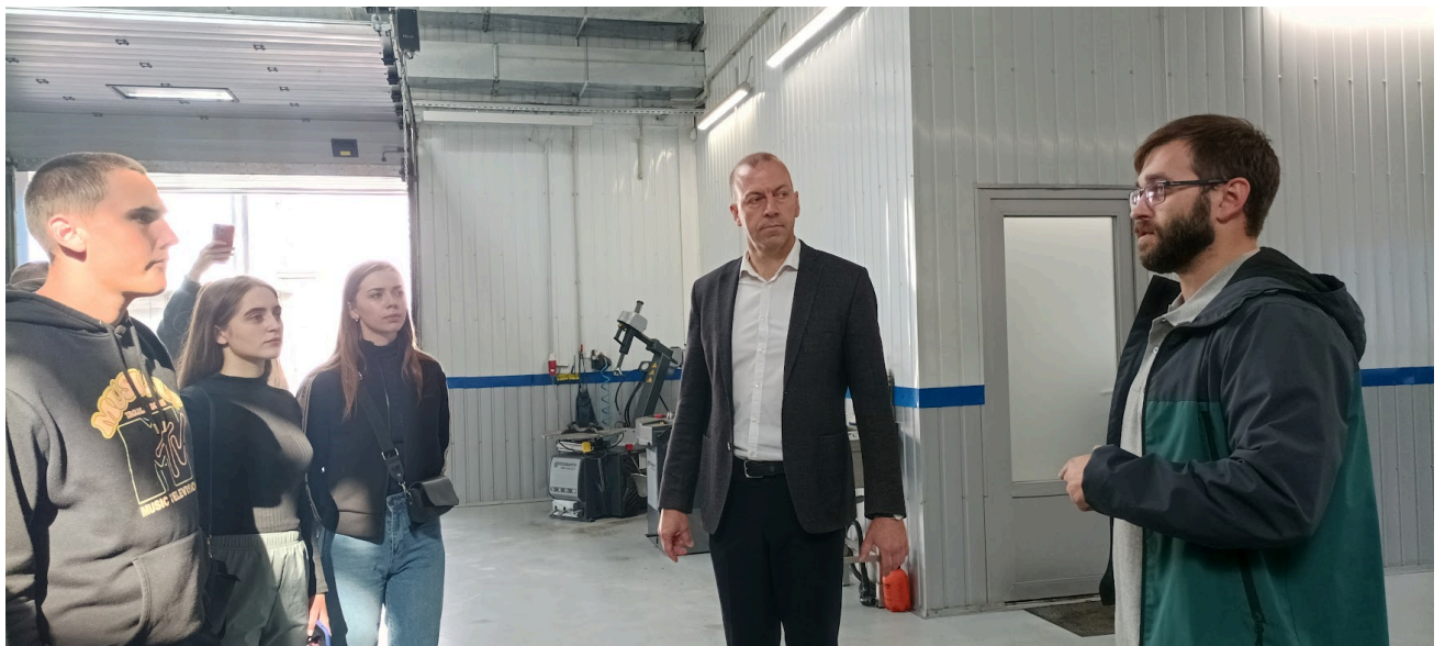
ТОВ «Перфект Моторс»