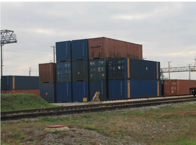
ФІЛІЯ "ЦЕНТР ТРАНСПОРТНОГО СЕРВІСУ "ЛІСКИ"